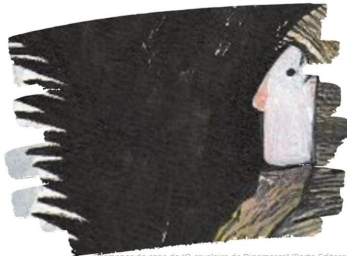
Formeja da capa de "O cavaleiro da Dinamarca" (Porto Editora)